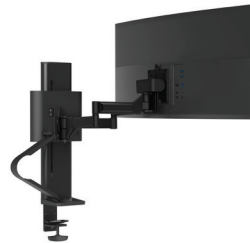
Simple avec pince à étau