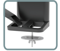
TIGE FILETÉE 98-492-009 (NOIR MAT)