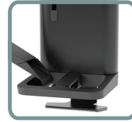
FAIBLE ENCOMBREMENT 98-490-224 (NOIR MAT)