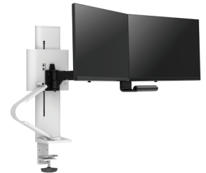
Double avec pince à étau