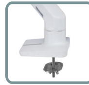
INCLUS : TIGE FILETÉE