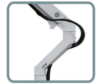
PASSAGE DE CÂBLES INTÉGRÉ AU BRAS