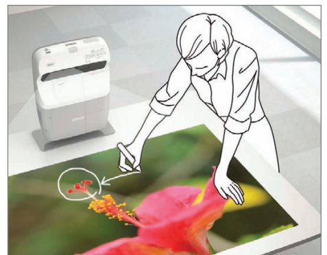
Projection sur toute surface horizontale, comme le plateau d'un bureau